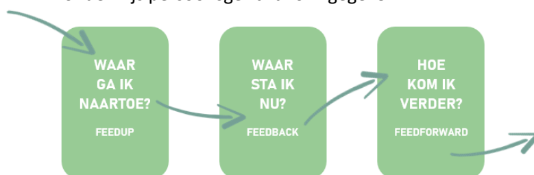
Figuur 1. Feedup, feedback en feedforward

Door regelmatig te evalueren en feedback te ontvangen, krijgt de student zicht op het eigen kunnen en kan daardoor beter beoordelen of er nog meer tijd aan het leren besteed moet worden en welke onderdelen van de leerstof aandacht vragen. Ze kunnen van de feedback ook leren wat de juiste antwoorden zijn. Op deze manier ondersteunt de feedback bij het reguleren van het leren. Vervolgens wordt op basis van de feedback bepaald hoe de student verder komt in zijn leerproces (feedforward). De leerstof wordt afgestemd op wat de student nodig heeft of nieuwe doelen geformuleerd worden (feedup). Op deze manier wordt het onderwijs persoonsgericht vormgegeven.